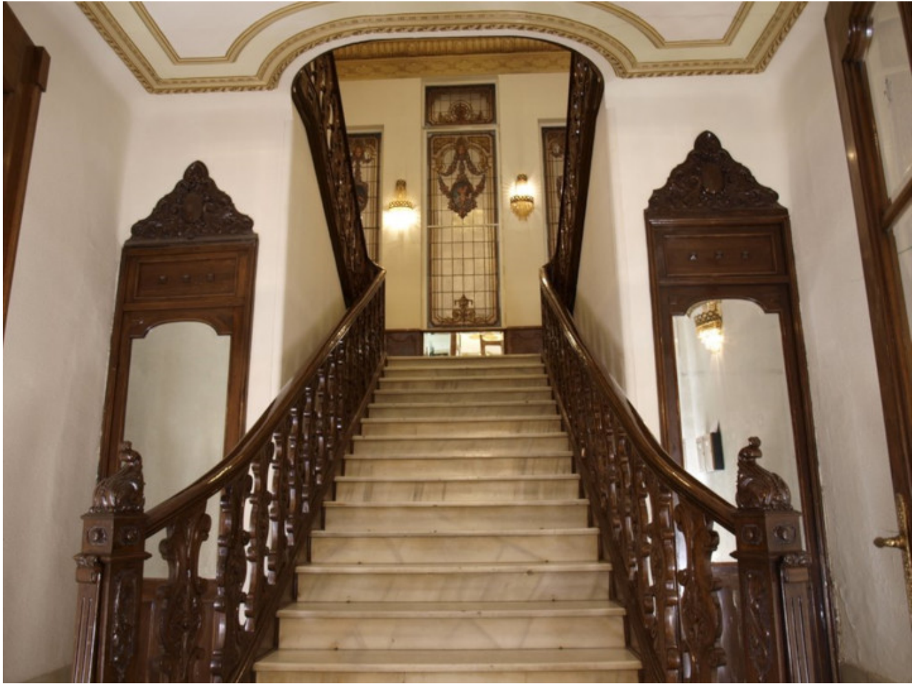
Escaleras del interior del edificio Montecasino, lugar donde estaba el Tribunal de Responsabilidades Polítics, y que en la actualidad es la sede de La Caixa.