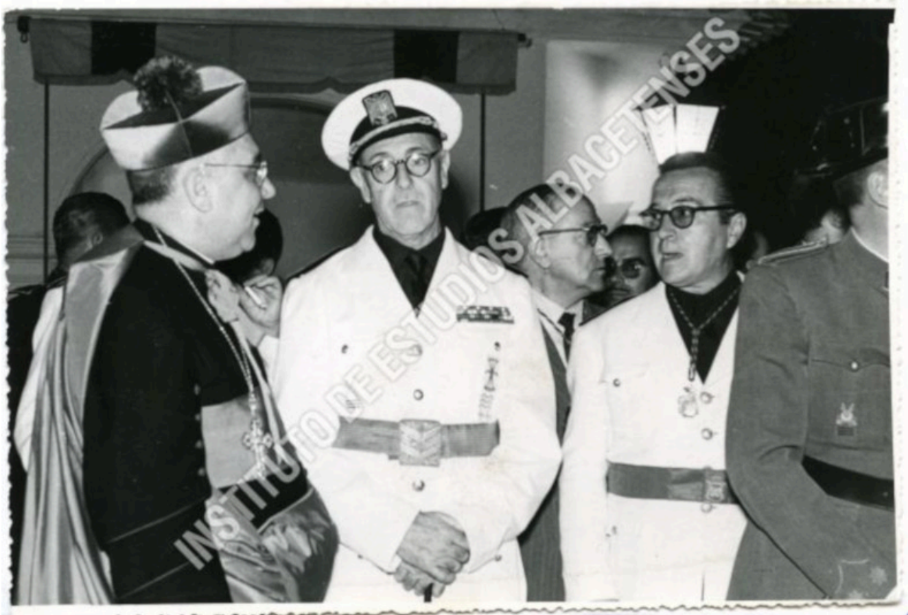
Inauguración de la Feria de Albacete, aparecen el Obispo Tabera junto al Gobernador Civil Francisco Rodríguez Acosta y el Alcalde Luis Martínez de la Ossa, mediados de los años 50.