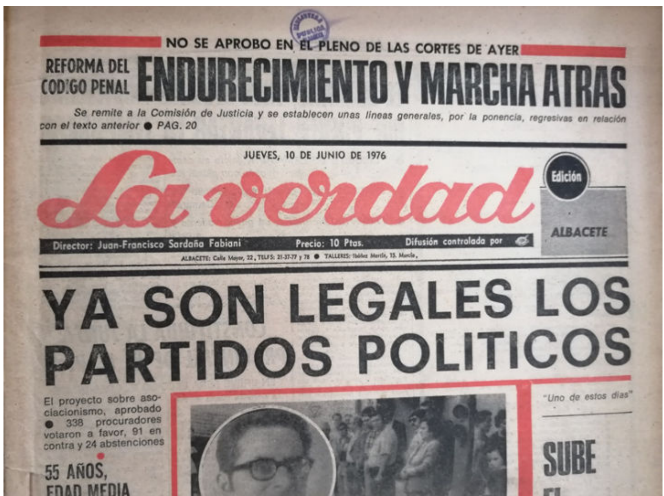
Encabezado de La Verdad. Fuente: La Verdad, 10.06.1976.