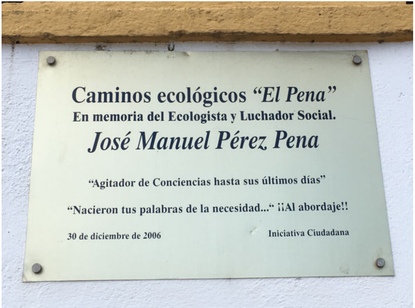
Detalle de la placa en homenaje a Pérez Peña por su incansable activismo social y ecológico.