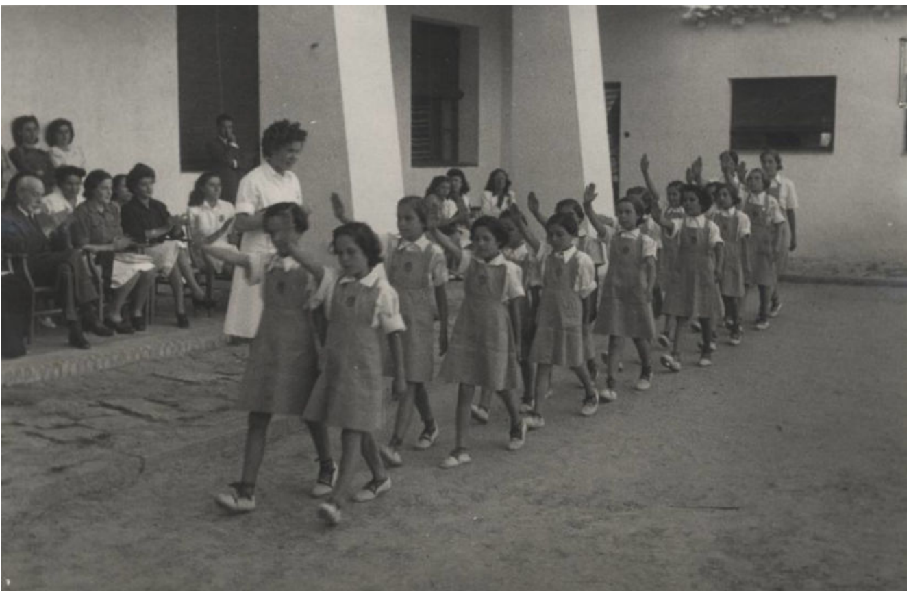
Un grupo de niñas desfila durante un acto de la Sección