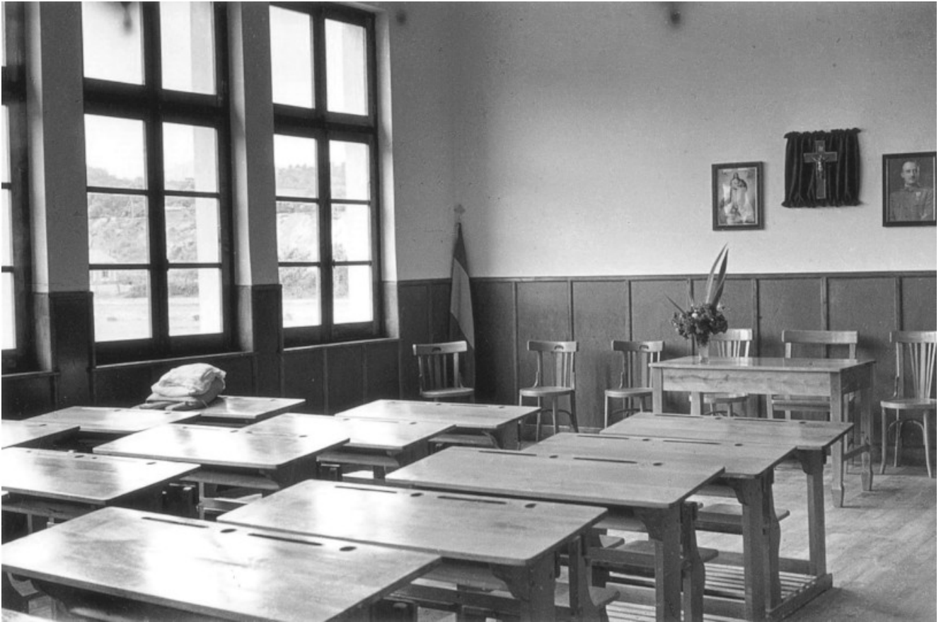
Aula de un colegio de monjas, 1954. Valentín Vega. Fuente: Colección "Vida cotidiana" Memoria digital de Asturias.