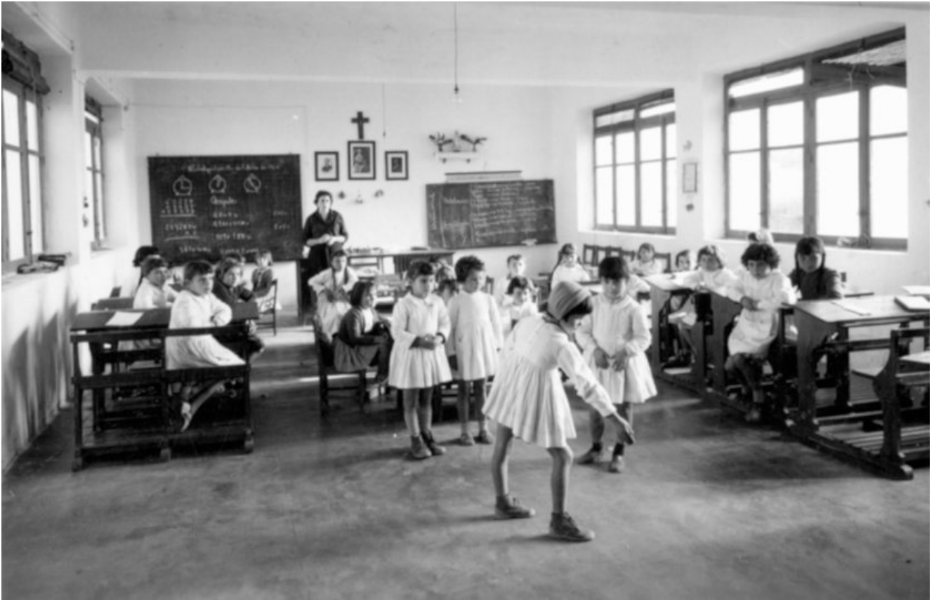
El aula de un colegio durante la dictadura franquista.